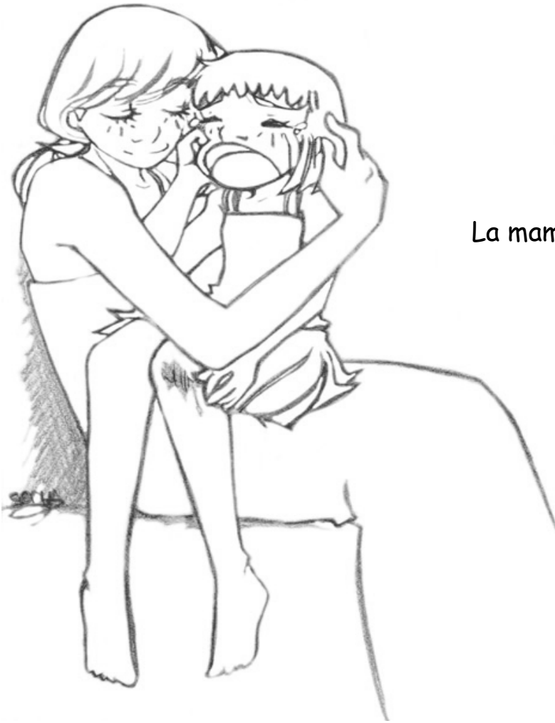
La maman réconforte